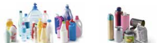
BOUTELLES ET FLACONS PLASTIQUES