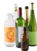
BOUTELLES EN VERRE